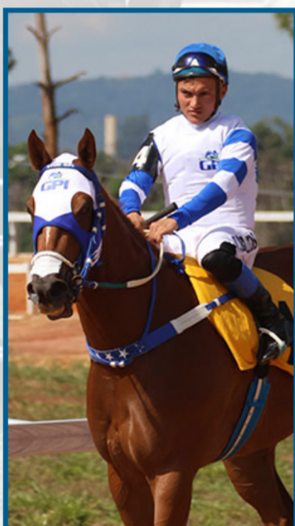
RED RUN LAKE