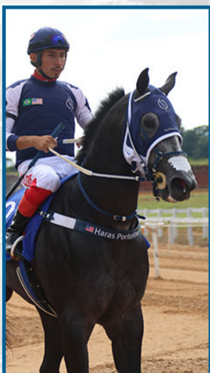
UCRANIA JUMPIM MRL