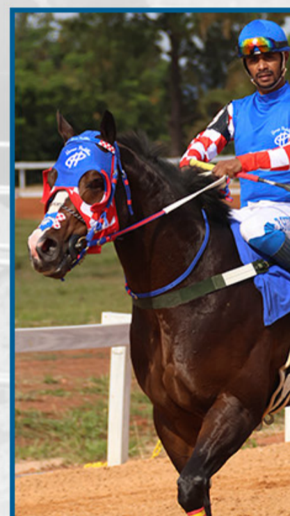
METEORO CORONA WA